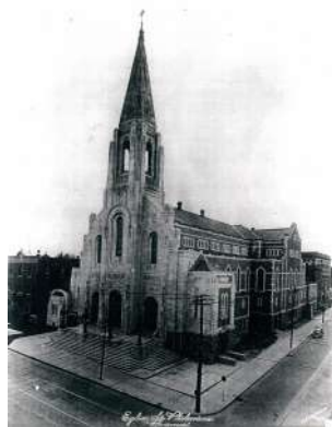
Église Ste-Philomène 1936