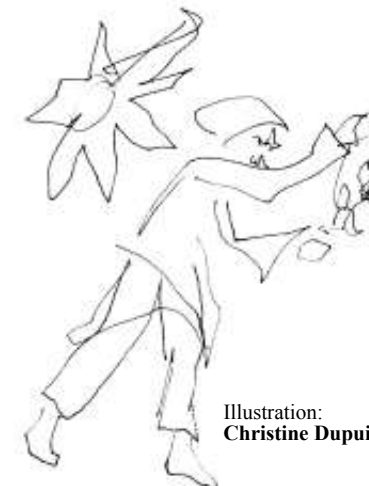
Illustration: Christine Dupuis

Les auteurs annoncent la suite consacrée aux Indiens et aux Métis, ceux qui ont "perdu l'Amérique", ces remarquables dépossédés.