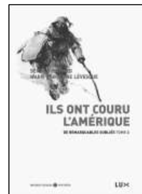
Ils ont couru L'Amérique, Lux Éditeur, 2014