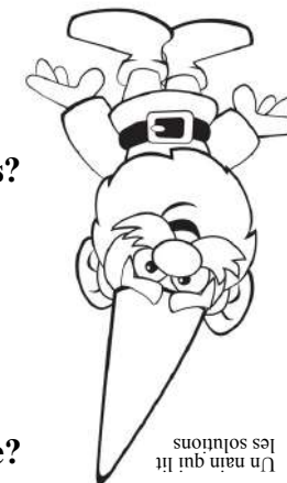
Un nain qui lit les solutions