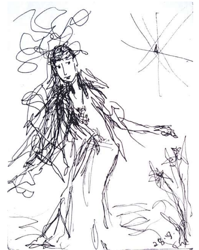
Illustration: Christine Dupuis

Noémie Lamoureux Jeune résidente du Vieux-Rosemont